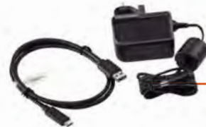
KIT DE ALIMENTACIÓN