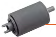
RODILLO DE TRACCIÓN