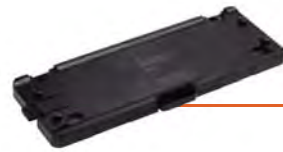
BANDEJA DE SALIDA