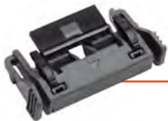
RODILLO DE SEPARACIÓN