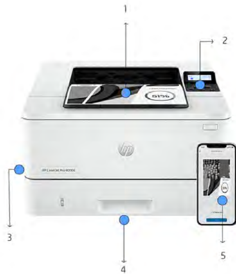
Imagen de la impresora HP LaserJet Pro 4002dw